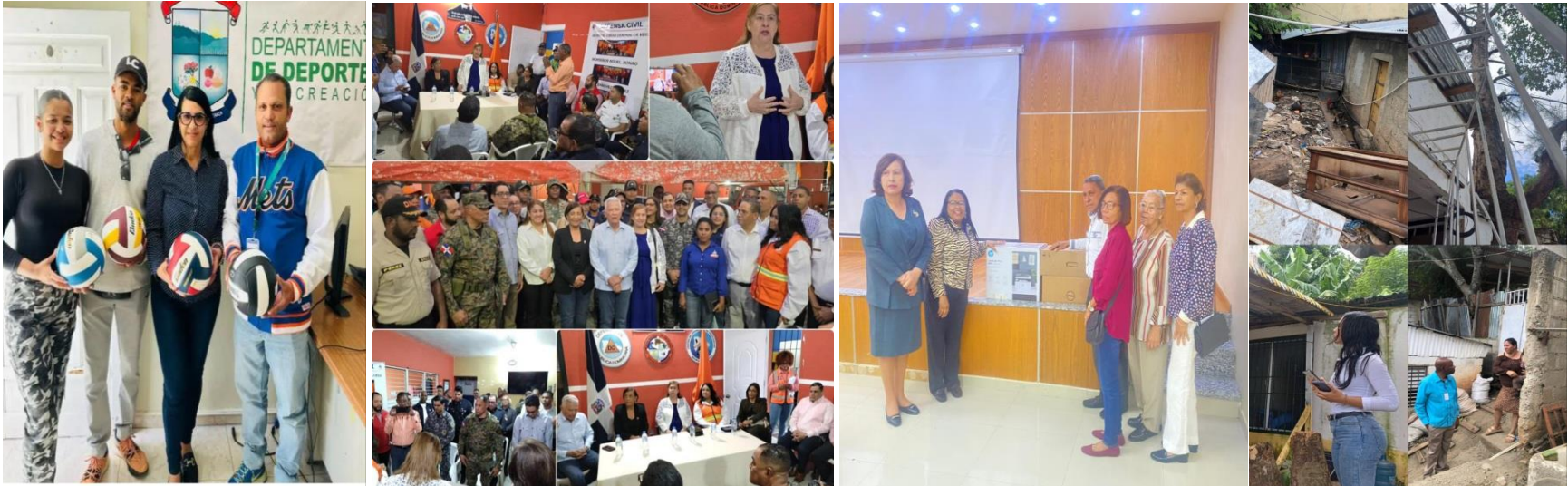
Tabla de Problemáticas Resueltas en el mes de Abril 2025